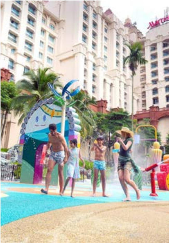
Family Splash Pool

Industri MICE sangat menjanjikan karena dampak ekonominya yang besar. Wisatawan bisnis biasanya menghabiskan waktu 3-5 kali lebih lama dibandingkan turis biasa, dan memberikan dampak ekonomi yang luas bagi sektor perhotelan, acara, transportasi, dan UMKM lokal. Tak seperti wisatawan biasa yang hanya datang pada musim-musim tertentu, kegiatan MICE menghadirkan wisatawan yang stabil sepanjang tahun sehingga memastikan stabilitas jangka panjang bagi sektor perhotelan.