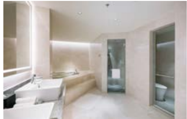
Bathroom Palace Suite