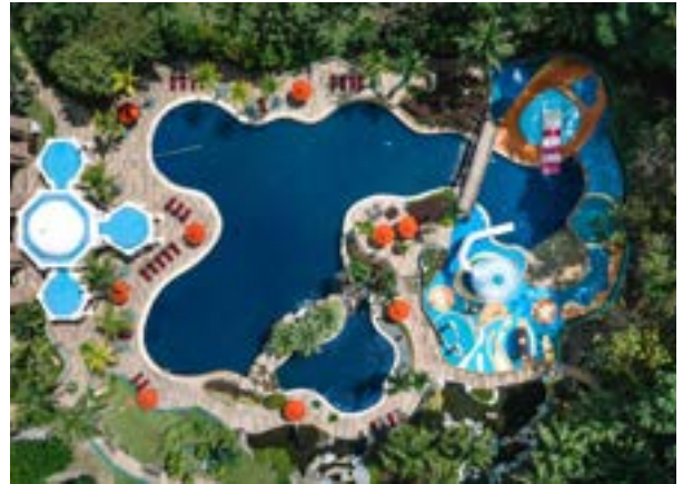
Swimming Pool Top View

Selain itu, mayoritas turis bisnis juga memperpanjang masa tinggalnya untuk berlibur, atau juga dikenal dengan istilah bleisure . Putrajaya Marriott berusaha memenuhi kebutuhan turis bleisure dengan tidak hanya menyediakan fasilitas MICE, tapi juga fasilitas hiburan, seperti lapangan golf Palm Garden Golf Club atau berbelanja di IOI City Mall.