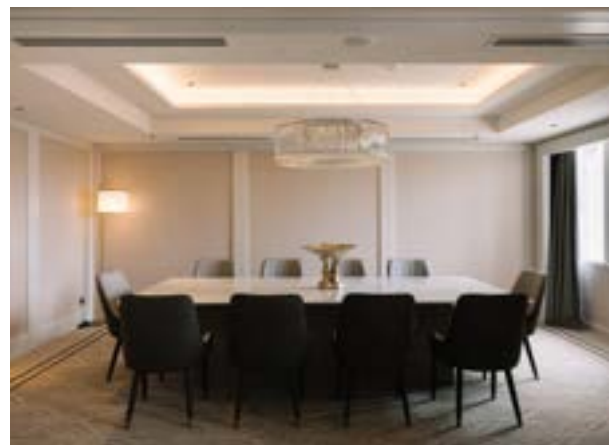
Dining Area Palace Suite