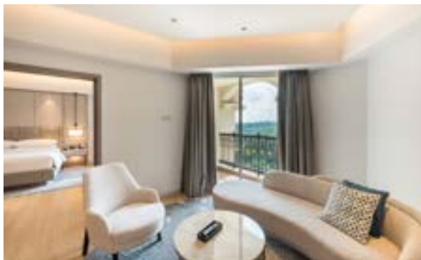
Room View Exec Suite

Marriott Putrajaya International Convention Centre (MPICC) juga memperkuat Putrajaya Marriott Hotel untuk memikat delegasi MICE internasional. Hotel ini juga memiliki lebih dari 20 ruang pertemuan fleksibel dan fasilitas teknologi meeting hibrid, termasuk layar LED 3D di MPICC yang tidak hanya menambah kesan modernitas, tapi juga lebih ramah lingkungan.