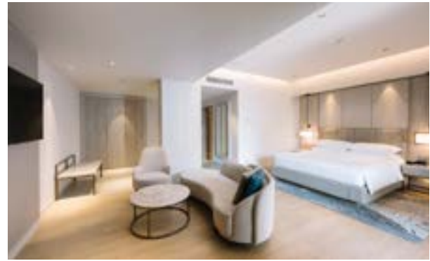
Room View Junior Suite

Salah satu keunggulan utama Putrajaya Marriott Hotel adalah lokasinya yang strategis di dalam kawasan IOI Resort City sehingga memudahkan akses ke Kuala Lumpur International Airport (KLIA), Putrajaya Sentral, dan akses kereta cepat IOI Resort City Express Line ke Singapura. Hal tersebut tentunya akan memudahkan para delegasi internasional untuk datang ke Malaysia.